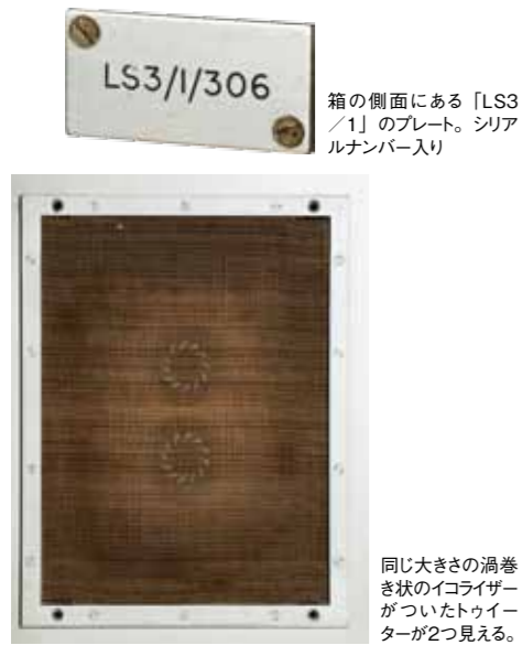
箱の側面にある「LS3 / 1」のプレート。シリアルナンバー入り

BBCはNHKと同じような国営放送局であり、かなり昔から放送される音質の良いことで知られていた。その陰では音の美しさを追求して放送機器の性能を改善していくために、長い地道な研究開発の中から初代大型モニタースピーカーのLS / 1をはじめとして、ステレオ時代になってからはLS 5 / 1、LS 3 / 1が開発され、その後のLS3 / 5A等へと受け継がれていった。その実績はその後の英国のスピーカーメーカーであるKEF、ロジャース、チャートウエル、B&W、スペンドール、ハーベス等に大きな影響を与えていった。