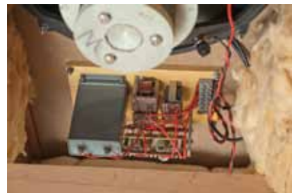
LS3 / 1のネットワーク部